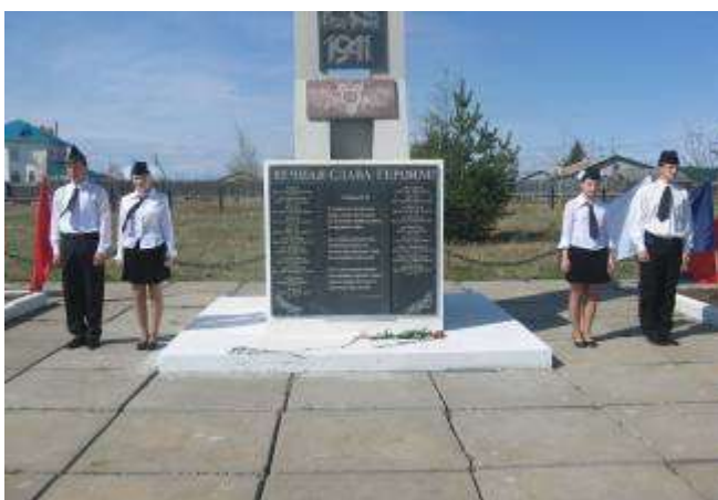
Почетный караул на Обелиске Славы.