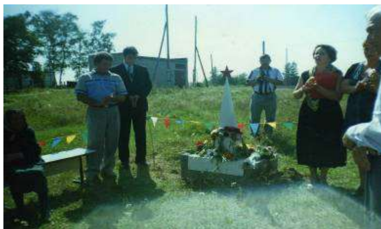
Торжественное установление камня.

Первоначально было решено воздвигнуть Обелиск Славы на площади школьного двора. Залили пьедестал, на котором должен был возвышаться наш Обелиск Славы. Однако на народном сходе многие жители были против такого решения и предложили установить Обелиск Славы на пустыре, между детским садом и школой. Это предложение понравилось большинству. Так и решили, и в августе 1999 года торжественно установили камень, на месте которого будет наш Обелиск Славы.