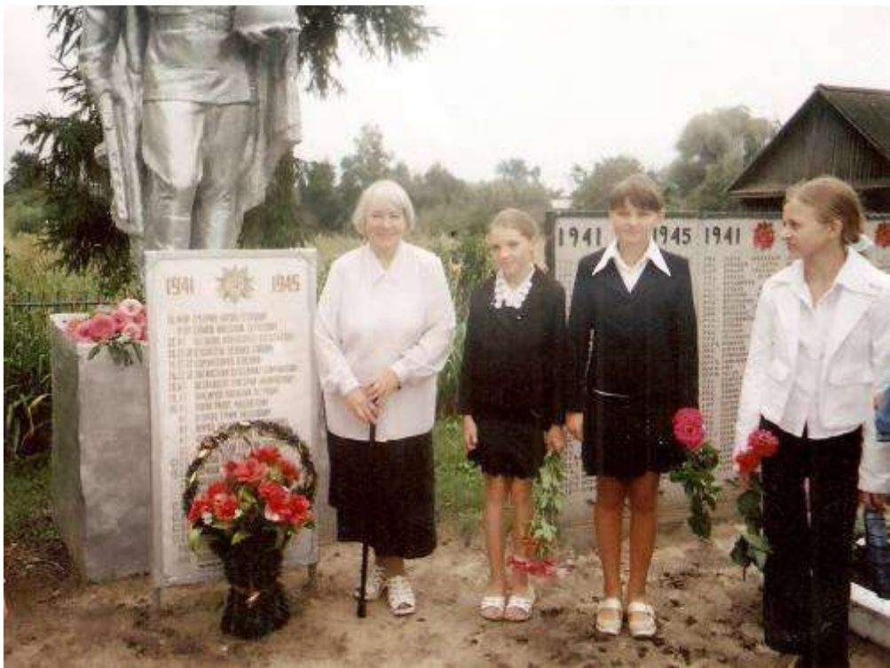
На фото актив музея деревни Ильинское, Орловской области.