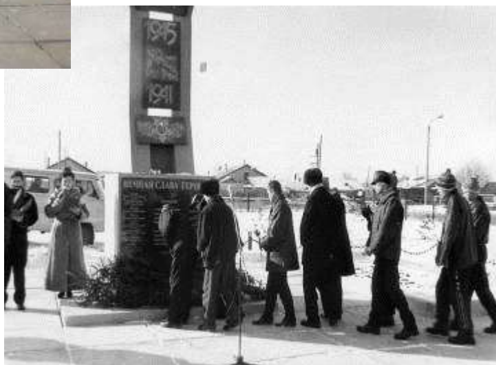
Призывники отдадут дань уважения пред тем как уйти в армию.